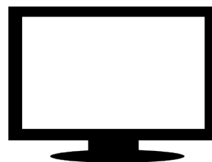
MONITOR LG IPS

*Los productos arriba indicados pueden estar sujetos a modificación por otros similares según disponibilidad.